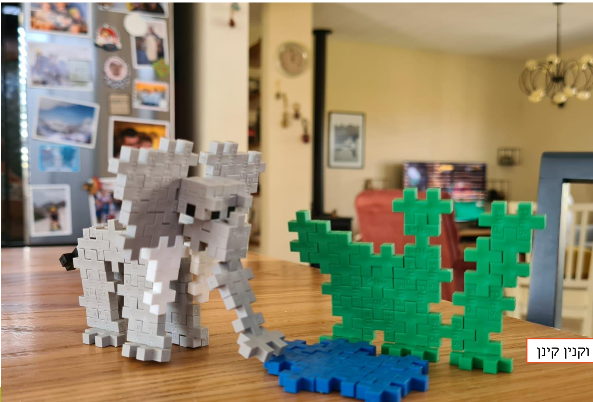
ארד וקנין קינן