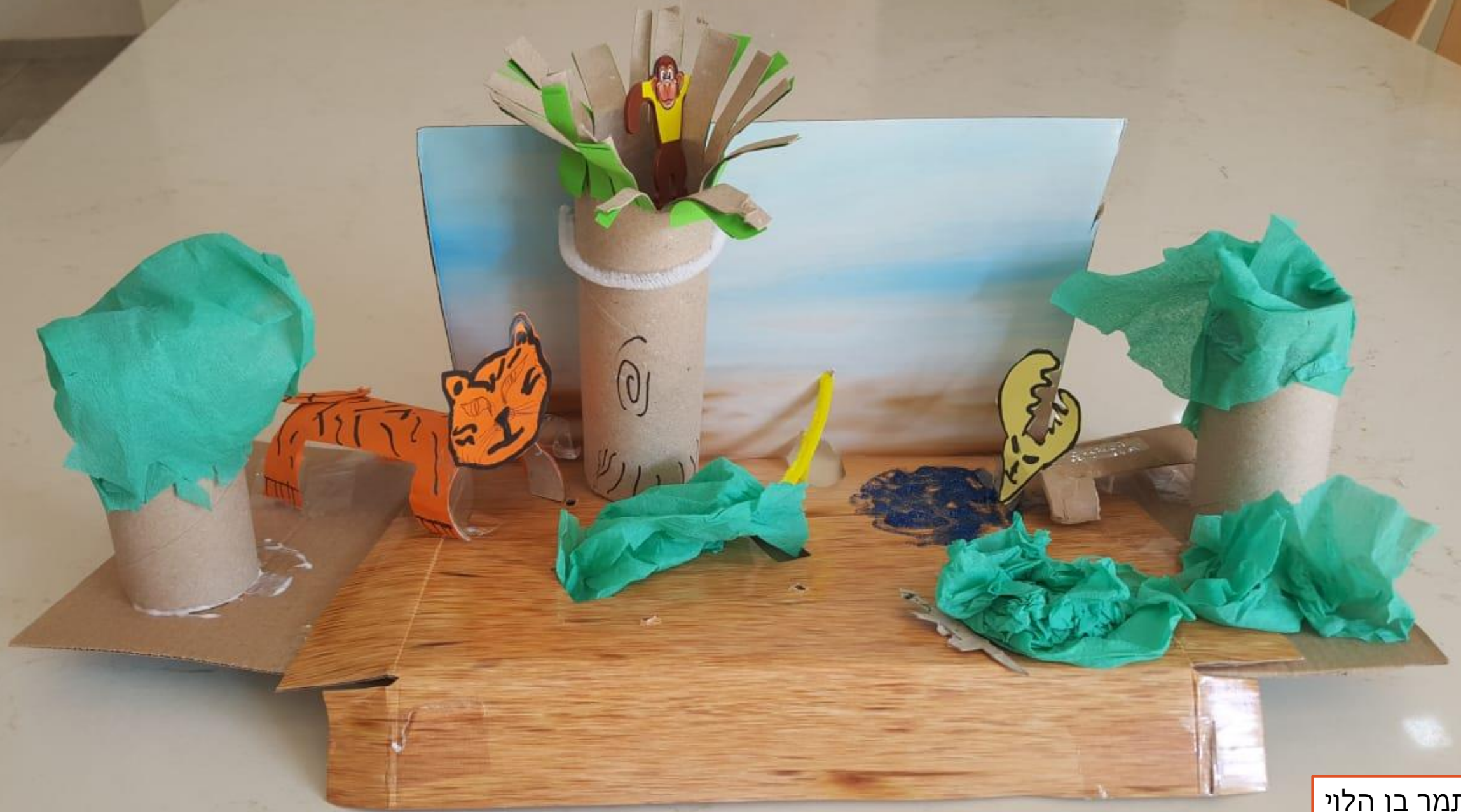
איתמר בן הלוי