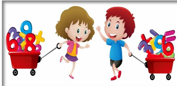
ליקטה וערכה: ציפי בר-לב וייס